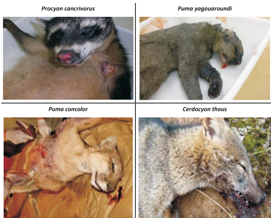
FIGURA 2 – Animais resgatados no período de agosto de 2007 a abril de 2013 em quatro rodovias da região do Planalto do Estado de Santa Catarina.