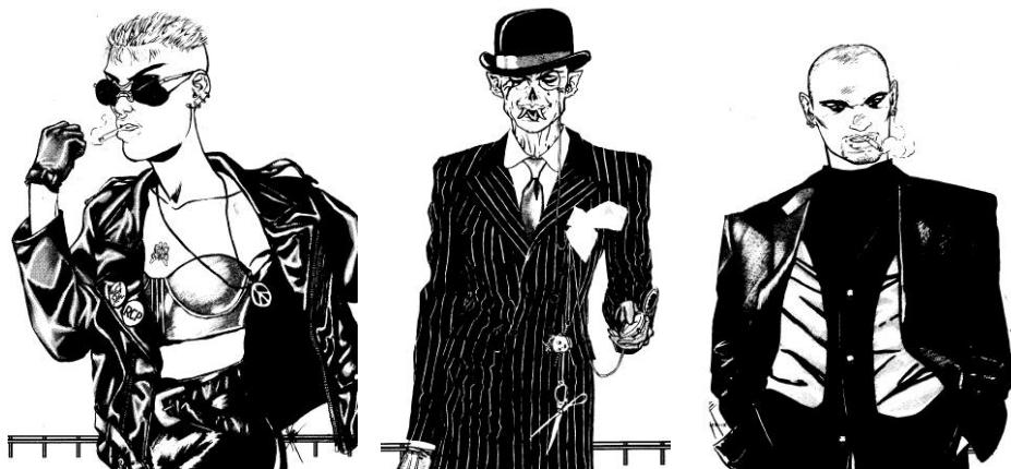
Fig. 3: (a) Vampiro do Clã Brujah (b) Vampiro do Clã Nosferatu (c) Vampiro do Clã Ventrue

parte do seu personagem será diferente de você mesmo [...] mas sempre, de algum modo, o personagem refletirá algum aspecto de você mesmo”.