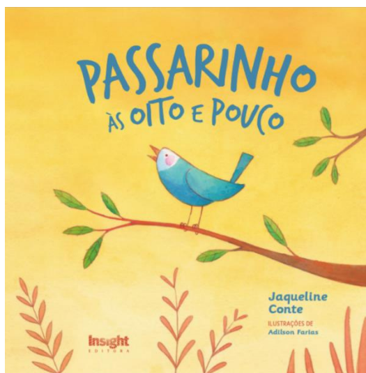
Figura 2: Capa do livro impresso “Passarinho às oito e pouco”.

Utilizando o smartphone para ler o código QR impresso no livro 7 , o leitor é levado para o site , que traz uma gama de informações e de propostas, em diferentes linguagens e mídias: áudios com as narrações da história, com opção de idioma (português ou inglês) e de voz (masculina ou feminina); música; galeria de fotos; vídeos que documentam a ave; hiperlinks para conteúdos externos rigorosamente selecionados; textos escritos; propostas de interação com o leitor.