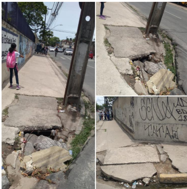
Imagem 1: Calçadas esburacadas na avenida

despeito disto, as crianças, normalmente, precisam caminhar mais de 100 metros para atravessar a via, dado que a faixa não conta com semáforo e os motoristas também não respeitam a prioridade aos pedestres, desobedecendo o que recomenda o “Código de Trânsito Brasileiro (CTB)” (BRASIL, 1997).