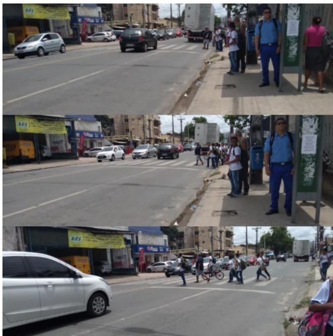
Imagem 3: Travessia na faixa de pedestres à frente da escola