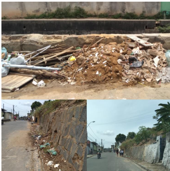
Imagem 2: Calçadas impróprias à circulação