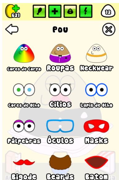
Figura 2 - Produtos da loja

Imagem obtida a partir do aplicativo Pou