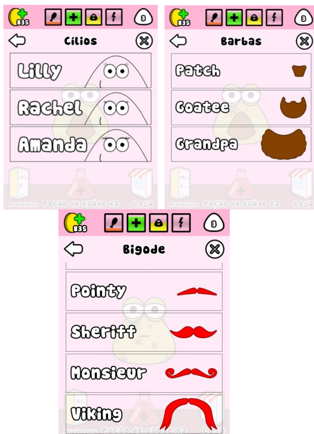
Figura 3 - Elementos generificados

Imagens obtidas a partir do aplicativo Pou