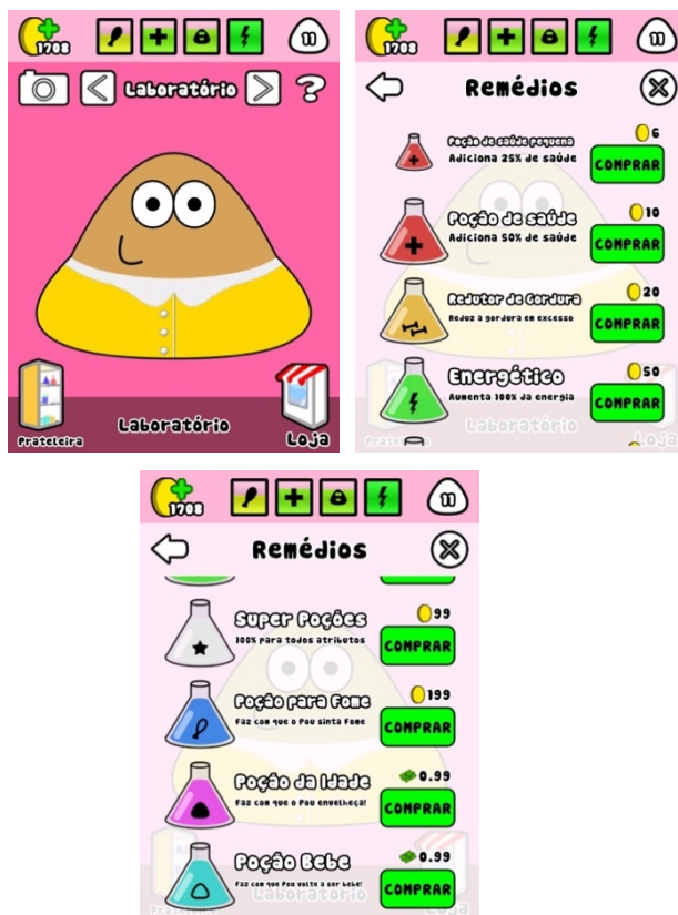
Figura 9 - Poções

Imagens obtidas a partir do aplicativo Pou