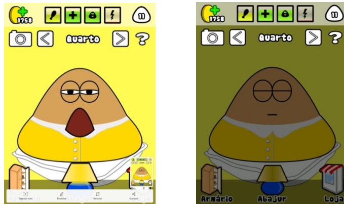
Figura 7 - Energia

Imagens obtidas a partir do aplicativo Pou