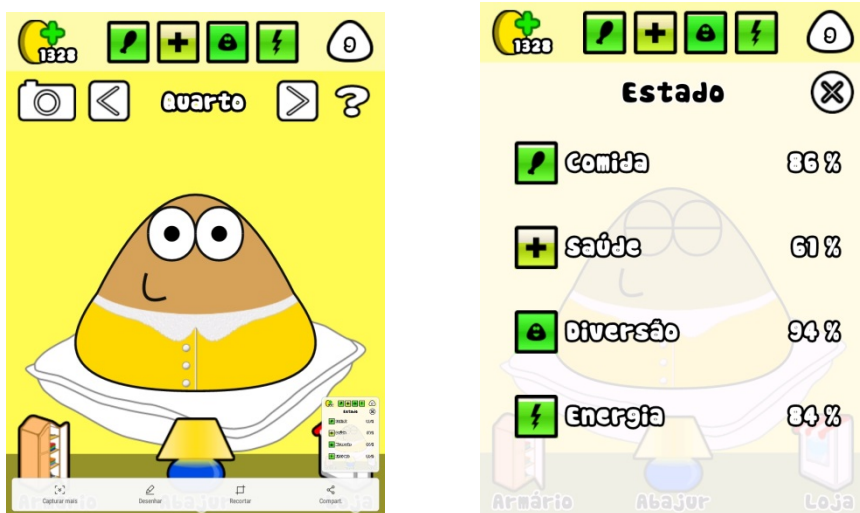
Imagens obtidas a partir do aplicativo Pou

No caso de pouca comida, deverá adquirir alimentos e fornecê-los ao Pou. Contudo, é necessário cautela, pois comida em excesso deixará o Pou obeso. Para alimentar o Pou, o jogador pode escolher frutas, verduras, sopas, frutos do mar, sushi, produtos de café da manhã, guloseimas, snacks, doces, sobremesas e bebidas. A ingestão de um alimento aumenta o nível de comida do avatar. Entendemos que observar os efeitos dos alimentos sobre o avatar reforça a ideia de que o jogo funcione como uma pedagogia cultural. A Fig. 5 apresenta o menu de dois grupos de alimentos: legumes e sobremesas. É possível observar que ao lado do alimento encontra-se o índice de acréscimo de comida que sua ingestão acarreta. Repolho acrescenta 15% e sorvete 10%. Entretanto, os legumes, além de fazer crescer a comida, também aumentam o índice de saúde em 1%. Já as sobremesas, aumentam também o nível de