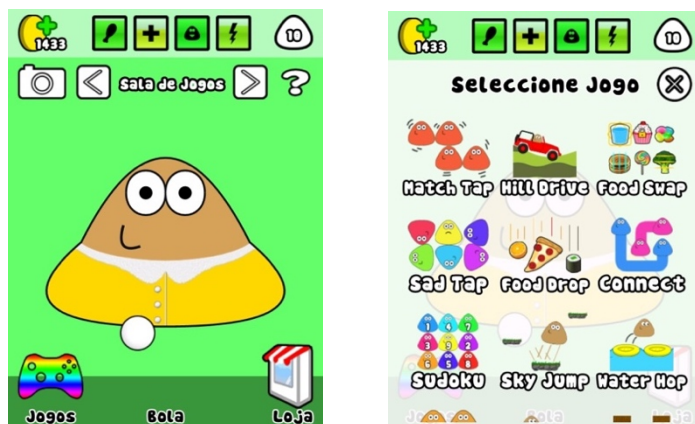
Figura 6 - Diversão

Imagens obtidas a partir do aplicativo Pou