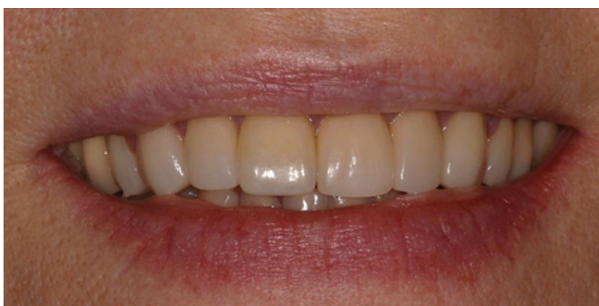
Figura 15 - Fotografia final do sorriso.