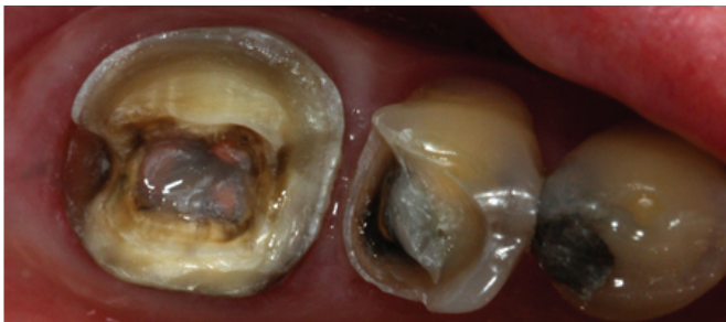
Figura 5 - Preparos nos elementos 45 (onlay) e 46 (overlay/endocrown).

das peças, nas cores A3 cervical/médio e A2 incisal (pastilha A2 MT), foram checados ponto de contato, adaptação marginal e cor. As mesmas foram cimentadas com o seguinte protocolo: Isolamento Absoluto; Condicionamento do dente com Ácido Fosfórico 37% por 15 segundos; Condicionamento da peça com Ácido Fluorídrico 10% por 20 segundos; Aplicação de Silano na peça por 1 min; Aplicação de Adesivo Excite F DSC (Ivoclar Vivadent) no dente e na peça; Cimentação com Allcem Dual (FGM) . A verificação dos contatos oclusais foi realizada com papel articular e pinça Muller .