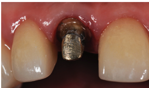
Figura 10 - Preparo do elemento 11. Observa-se núcleo metálico fundido e escurecimento da raiz.

Quanto aos preparos, os elementos 13, 12, 21 e 22 estavam com a face palatina bem preservada. Neles, foram planejados laminados cerâmicos com preparo envolvendo incisal e proximais. Os elementos 14, 23, 24 e 25 estavam amplamente restaurados em resina composta, portanto tiveram preparo para coroa total cerâmica.