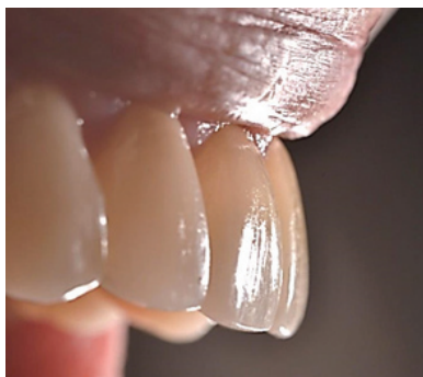
Figura 16 - Fotografia final de perfil (dentes ântero-superiores).