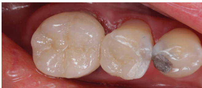
Figura 6 - Aspecto clínico das restaurações em cerâmica IPS e.max Press cimentadas nos elementos 45 (onlay) e 46 (endocrown).