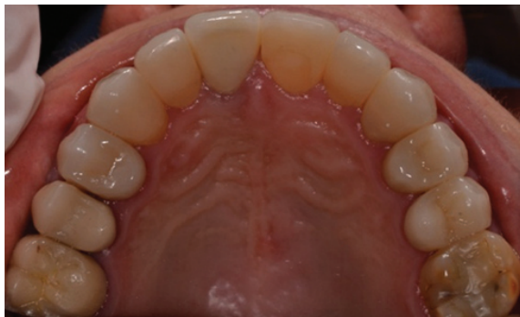
Figura 14 - Vista oclusal da arcada superior, evidenciando a harmonia entre as peças cerâmicas.