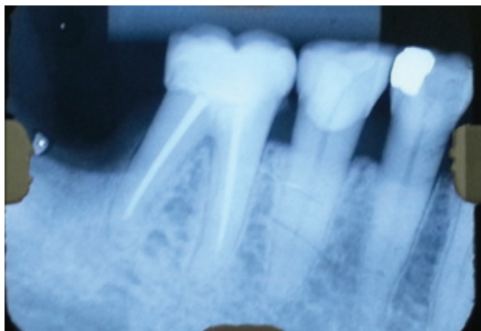
Figura 7 - Radiografia periapical após a cimentação das peças cerâmicas nos elementos 45 e 46.