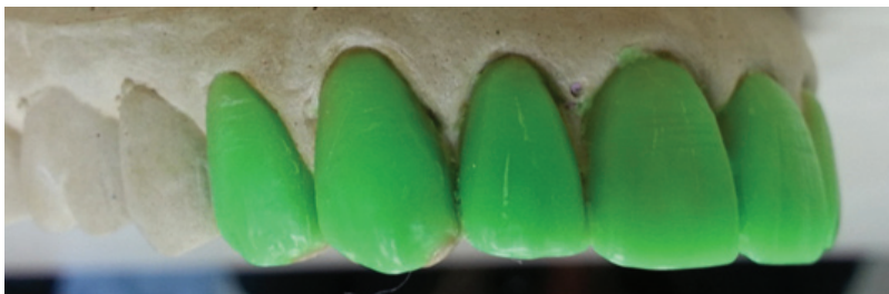
Figura 8 - Enceramento diagnóstico: planejamento da nova realidade para a boca da paciente.

Quanto à arcada superior, a reabilitação incluiu nove elementos: 14, 13, 12, 11, 21, 22, 23, 24 e 25. O planejamento contemplou a realização do enceramento de diagnóstico, para a visualização da nova realidade dentária, possibilitando a prova estética do trabalho no paciente (Figura 8). O mock-up , feito com Resina Bisacrílica a partir de um molde do enceramento, constituiu na reprodução do enceramento em boca, para que o paciente e o Cirurgião-Dentista pudessem visualizar, modificar e aprovar o formato dos futuros elementos dentários (figura 9). Além disso, o enceramento serve de guia para os desgastes dentários.