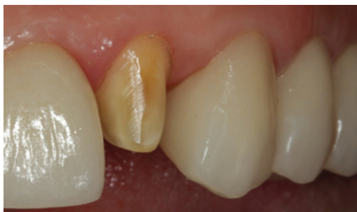
Figura 12 - Prova das restaurações indiretas cerâmicas (laminados e coroas).

os pontos de contato interproximais, adaptação marginal, cor e estética do sorriso (forma, tamanho, posição e proporções entre os dentes) (Figura 12).