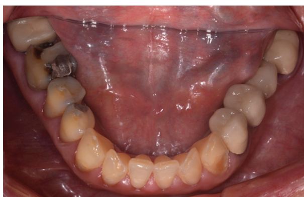
Figura 4 - Aspecto clínico inicial da arcada inferior.

A partir dos exames iniciais, definiu-se o diagnóstico e o planejamento do tratamento. O principal enfoque do planejamento para este caso clínico foi a reabilitação estética e funcional da paciente, através de restaurações indiretas em cerâmica, todas com o sistema IPS e.max Press (Ivoclar Vivadent).