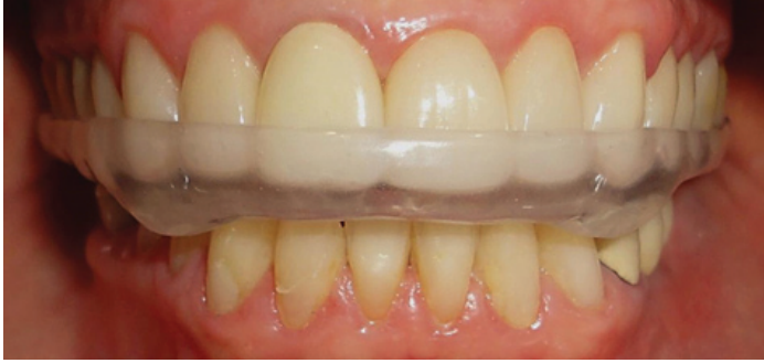
Figura 17 - Placa miorelaxante acrílica instalada.