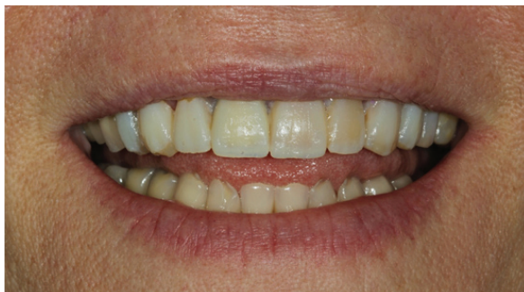
Figura 9 - Prova do mock-up : avaliação do formato, tamanho e posição dos elementos dentários projetados em resina bisacrílica (cópia do enceramento).

O elemento 11 possuía uma coroa metalocerâmica deficiente sobre um núcleo metálico. A coroa foi removida e o núcleo foi mantido (Figura 10). Como este era o único elemento com substrato diferente dos demais, em função do núcleo metálico e raiz escurecida, foi planejada uma coroa total com infraestrutura opaca ( IPS e.max Press pastilha HO ), para mascarar o fundo. Após, recebeu aplicação de cerâmica ( IPS e.max ceram ) estratificada nas cores A3 cervical/médio e A2 incisal.