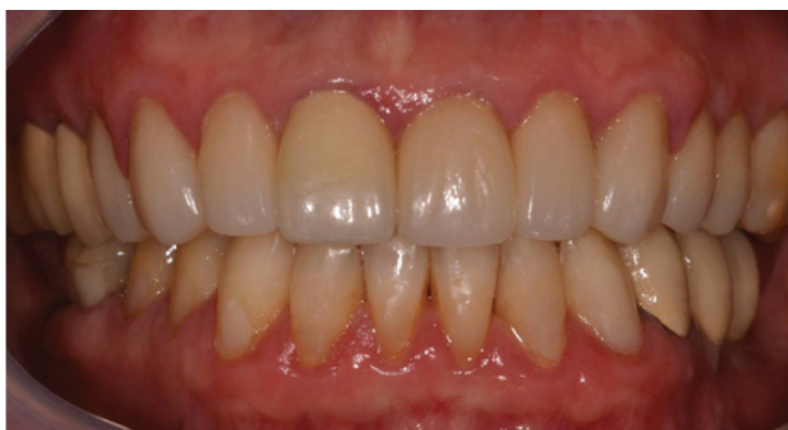
Figura 13 - Caso finalizado, reabilitação estética e funcional em cerâmica IPS e.max press.

As coroas cerâmicas dos elementos 14, 11, 23, 24 e 25 foram cimentadas da seguinte forma: Isolamento Relativo combinado com Afastador, algodão e Fio Retrator #000; Condicionamento da peça com Ácido Fluorídrico 10% por 20 segundos; Aplicação de Silano na peça por 1 min; Cimentação com Cimento Resinoso Auto-Adesivo Dual RelyX U200 (3M ESPE). Após acabamento de margens e ajuste oclusal. A finalização do caso encontra-se nas Figuras 13-16. A paciente recebeu uma placa acrílica miorelaxante para proteção e conforto articular, como visto na Figura 17.