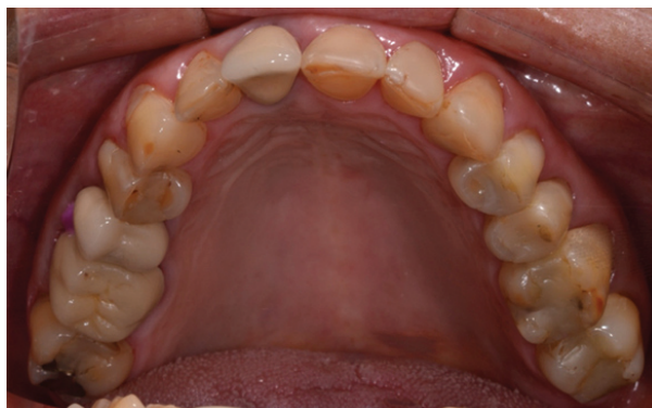
Figura 3 - Aspecto clínico inicial da arcada superior.