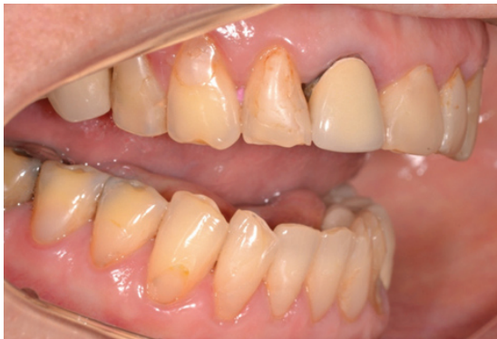
Figura 2 - Aspecto clínico intraoral inicial direito, evidenciando a desarmonia estética.