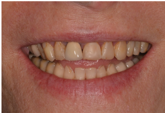
Figura 1 - Aspecto do sorriso inicial da paciente.

O caso clínico apresentado é de uma paciente do gênero feminino, 66 anos de idade, que procurou atendimento no Curso de Especialização em Dentística da Faculdade de Odontologia da UFRGS, a fim de melhorar a estética do seu sorriso. Ao exame clínico (Figura 1-2-3-4), percebeu-se que a mesma já realizara um grande número de intervenções odontológicas durante a vida, como restaurações diversas, tratamentos endodônticos, exodontias, implantes, e coroas protéticas. No exame clínico extra e intraoral, percebeu-se que a estética do sorriso estava prejudicada: Perda de suporte labial pela falta de volume dental, desgaste dos quatro incisivos superiores, trespasse vertical negativo (sorriso invertido), extenso número de restaurações insatisfatórias quanto à forma, cor e adaptação marginal.