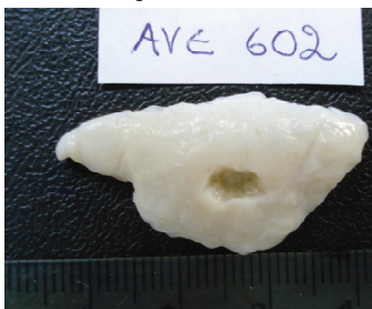
Figura 1. Lesão ulcerativa em pele de frango. Diagnóstico: QA