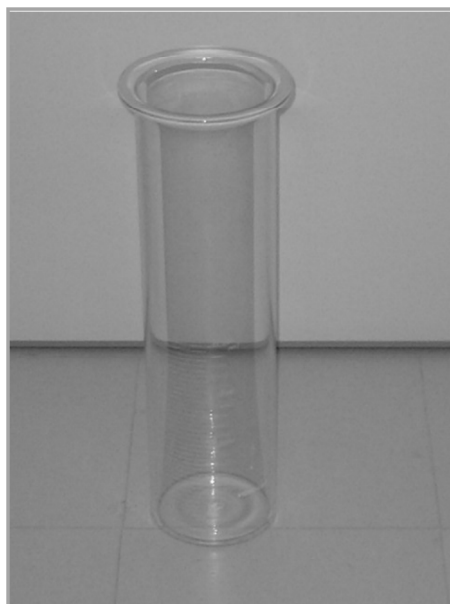
Figura 2 - Reator para ensaios de fotocátalise. Cilindro de vidro borossilicato graduado com capacidade para tratar 2L de efluente.

efluente e homogeneização do catalisador no interior do reator de vidro foi utilizado um agitador mecânico marca Fisaton modelo 722D com potência de 255W 115V ou 230V 60HZ; mandril vazado de diâmetro 10mm e haste de 600mm de comprimento com hélice tipo naval diâmetro 80mm; tacômetro digital para indicação da rotação (RPM).