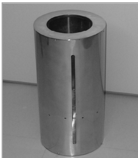
Figura 3 - Câmara em aço inox, onde serão instaladas as lâmpadas ultra-violeta. Dados construtivos: diâmetro Interno: 19 a 25 mm; altura: 410 a 425 mm; espessura: 2 mm; abertura superior: 125 a 135 mm.

das ultravioletas instaladas radialmente em seu interior (Figura 3).