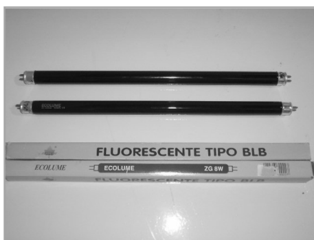
Figura 4 - Lâmpadas ultravioleta 8 Watts.

foram instadas no interior da câmara de inox (Figura 4).