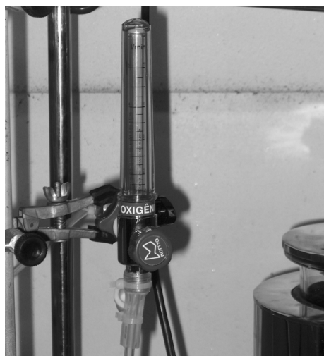
Figura 6 - Medidor de fluxo marca Moriya. Vazão: 0 a 5 L/min.

no interior do efluente através do difusor de ar (Figura 6).