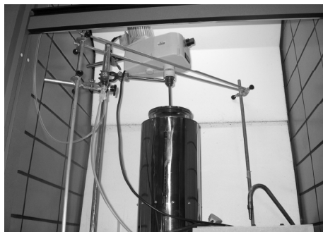
Figura 1- Reator de fotocátalise.

O equipamento construído é formado por: reator de vidro, câmara de inox, difusor de ar, lâmpadas ultravioleta, agitador mecânico, medidor de fluxo e cilindro de oxigênio.