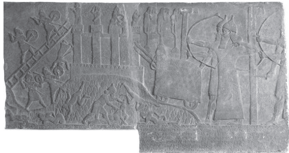
Figura 3 - Este relevo foi encontrado no palácio central de Tiglath – Pileser III, em Nimrud, datado entre 730 a 727 a. C., aproximadamente. Trata-se de uma representação de um ataque a uma cidade inimiga, provavelmente Upa, na Turquia, confeccionada em alabastro. Encontra-se no Museu Britânico, tendo como referencia: WA 115634 + 118903.