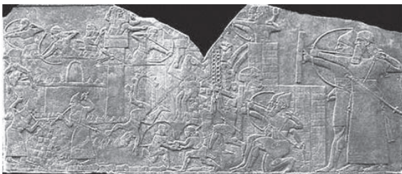
Figura 4B - Relevo de Assurnasirpal II.