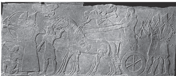
Figura 4C - Relevo de Assurnasirpal II.

Figura 4 - O relevo acima, dividido em três partes para melhor visualização, foi encontrado no palácio de Assurnasirpal II, em Nimrud, datado de 865 a. C., aproximadamente. Trata-se de uma representação do ataque a uma cidade inimiga com o rei Assurnasirpal II empunhando um arco de flecha, confeccionado em alabastro, com dimensões de 92 cm. Encontra-se, atualmente, no Museu Britânico, tendo com referência: WA 124554.