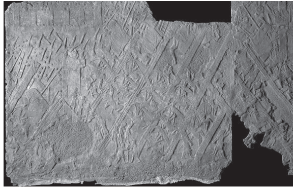
Figura 2 - O relevo acima foi encontrado no Palácio de Senaqueribe, em Nínive, Nordeste do Iraque, datado de aproximadamente 700 a 681 a.C. A imagem é uma representação do cerco a cidade de Lakish, confeccionada em alabastro, com dimensões de 1,67 m de comprimento por 1,90 m de altura. Encontra-se, atualmente, no Museu Britânico, tendo como referência: WA 124905-7.

As imagens para análise estão identificadas por Figura 2: Cerco à Lakish (BRITISH MUSEUM, 2008); Figura 3: Ataque a uma Cidade Inimiga (CURTIS e READE, 1995) e Figura 4: Cena de Batalha do Palácio de Assurnasirpal II (MESOPOTAMIA, 2009).