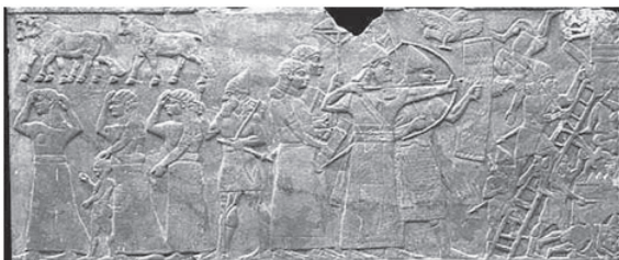
Figura 4A - Relevo de Assurnasirpal II.